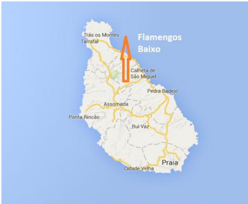
Figura 1: Localidade de Flamengos, Concelho de São Miguel

O presente documento refere-se às especificações técnicas de um Parque Fotovoltaico de 5 kWp para autoconsumo a instalar na estação de bombagem de Flamengos Baixo - FBE 210, situado no concelho de São Miguel, Ilha de Santiago, sobretudo para reduzir o custo associado a bombagem de água subterrânea.