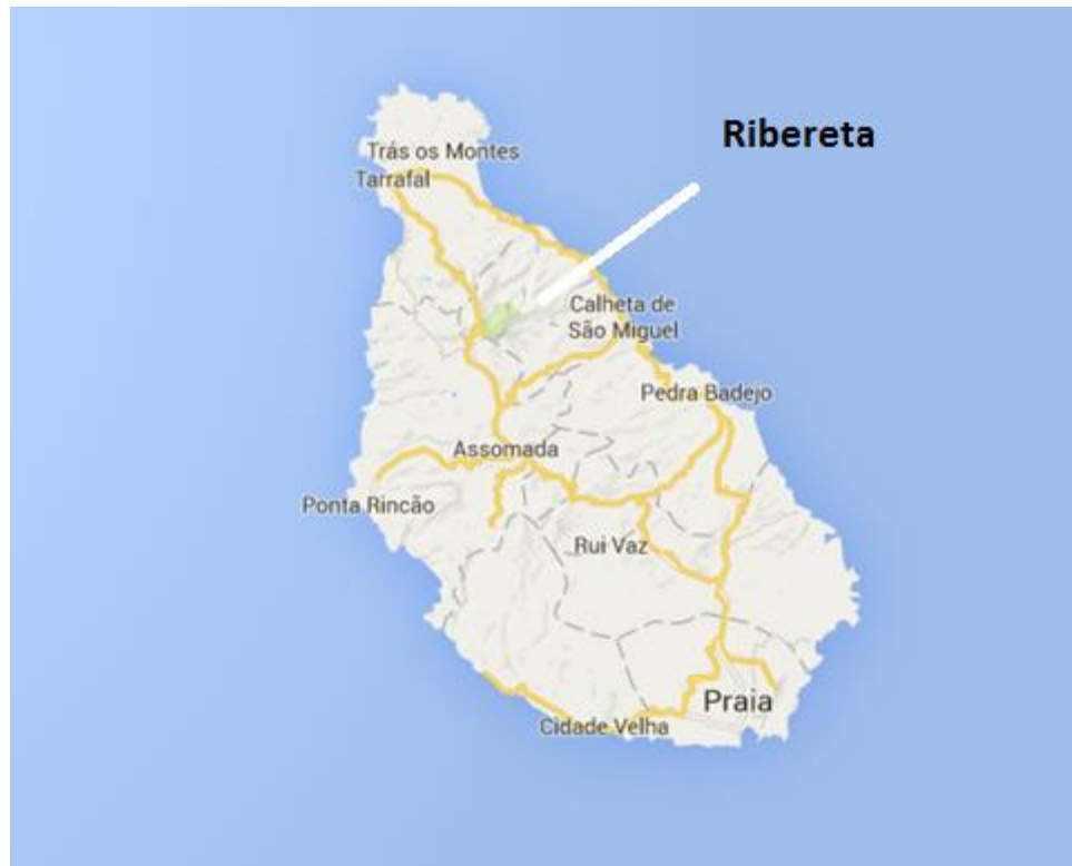
Figura 1: Localidade de Ribereta, Município de Tarrafal de Santiago

O presente documento refere-se às especificações técnicas de um Parque Fotovoltaico de 9 kWp para autoconsumo a instalar na estação de bombagem de Ribereta - FBE 181, situado no concelho de São Miguel, Ilha de Santiago, sobretudo para reduzir o custo associado a bombagem de água subterrânea.