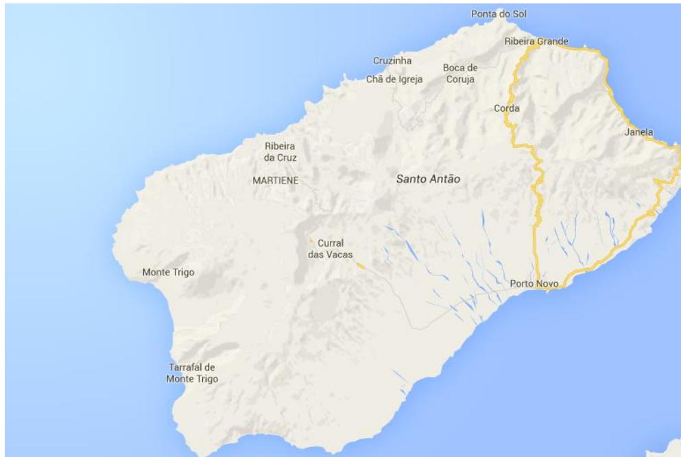
Figura 1: Município de Porto Novo

O presente documento refere-se às especificações técnicas de um sistema de produção de energia fotovoltaica, para autoconsumo sem bateria, a instalar na estação de bombagem de Ponte Sul – Chão de Matos (Referência FA 97), situada no concelho de Porto Novo, Ilha de Santo Antão.